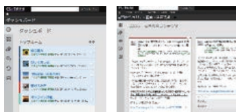
ポータルサイト(掲示板)