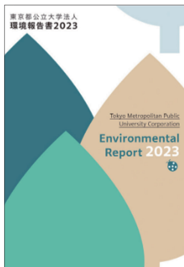
東京都立大学法人様