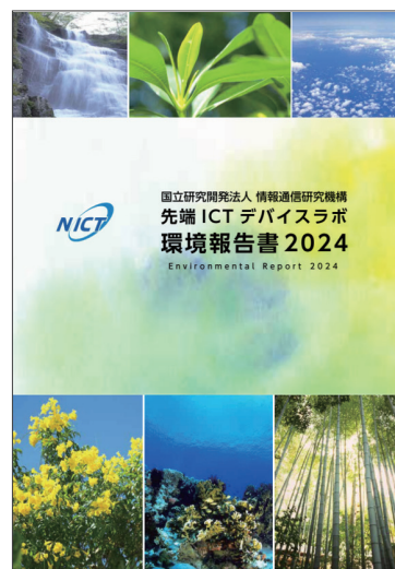
国立研究開発法人 情報通信研究機構様