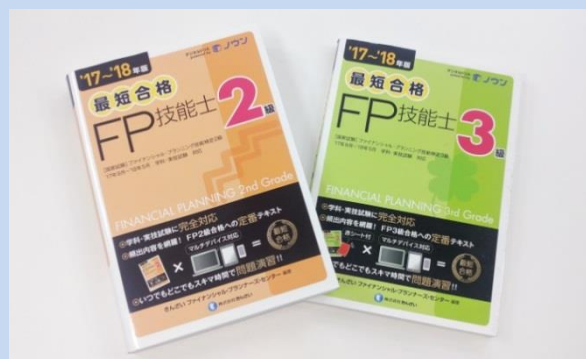
ノウンを採用した「最短合格2級FP技能士」「最短合格3級FP技能士」

今後は、ノウンによる学習履歴データを活用してより良い書籍の制作に取り組み、 来年度版のFP技能士精選問題解説集にも採用を広げる予定 など、ノウンによるデジタルドリルをつけた書籍のラインナップを増やしていきたいと考えています。