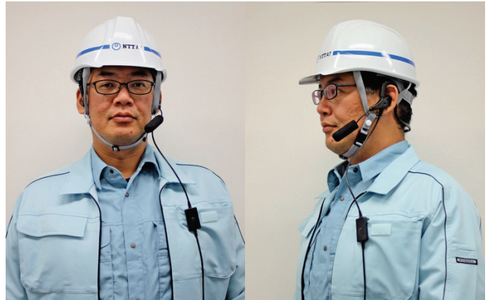
ヘルメットやメガネと干渉しにくいデザイン