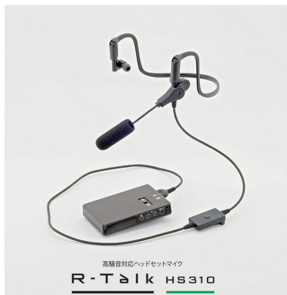
(図 1)専用ヘッドセット R-Talk HS310H(上)と、本体装置 R-Talk HS310B(下)

なお、2015 年 11 月 18～20 日に幕張メッセで開催される「Inter Bee 2015( http://www.inter-bee.com/ )」にて展示いたします。