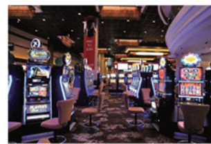
アミューズメント施設