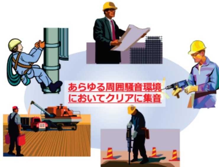
(図 2) 利用シーン